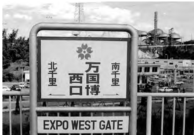
■万国博西口駅 後方にパビリオンが見えます