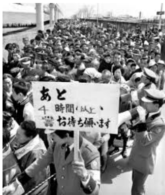
■大阪万博 月の石見学の行列