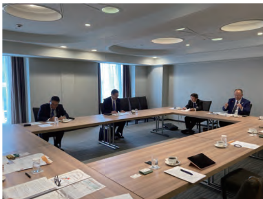
和やかに開催されました